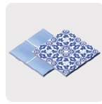
Loseta y cerámica