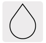
Para cortes en húmedo