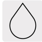
Para cortes en húmedo