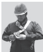
2. Abroche la hebilla que está a la altura de la cadera.