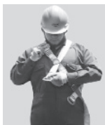
1. Abroche la hebilla que queda a la altura del pecho.