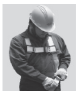
2. Abroche las correas que cuelgan a la altura de las piernas.