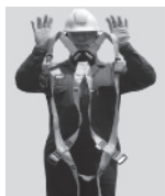
2. Sostenga el arnés de las correas de los hombros.