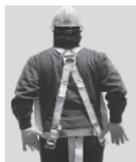
3. Colóquese el arnés como si fuera un chaleco; la anilla "D" debe quedar en la espalda y al centro de los hombros.