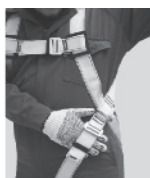
3. Regule todas las hebillas de tal forma que quepa una mano apretada entre la ropa y las correas.