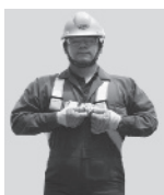
1. Abroche la hebilla que queda a la altura del pecho.