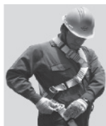
3. Abroche las hebillas que cuelgan a la altura de las piernas y proceda a regular.