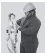
1. Tómelo de la anilla "D" que se encuentra entre las etiquetas de marca y las instrucciones