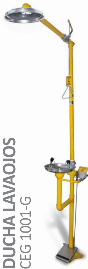
DUCHA LAVAOJOS CEG 1001-G

Ducha fabricada bajo norma ANSI Z-358.1.